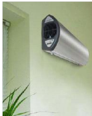
Lampada germicida UVC

Indaco oggi offre ai propri clienti i sistemi più innovativi per ridurre tali rischi e rendere l'aria interna fresca e pura .