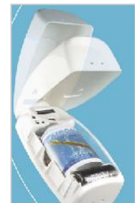
Airoma® Erogatore temporizzato

Pulisce e rigenera l'aria, elimina gli odori sgradevoli e riduce la crescita batterica sulle superfici